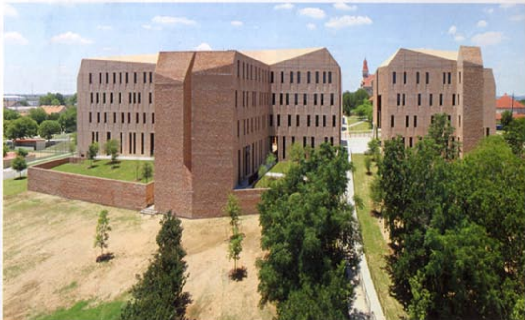
Dormitorio dell'università St.Edward / St.Edward's Dormitory, Austin, USA, 2008