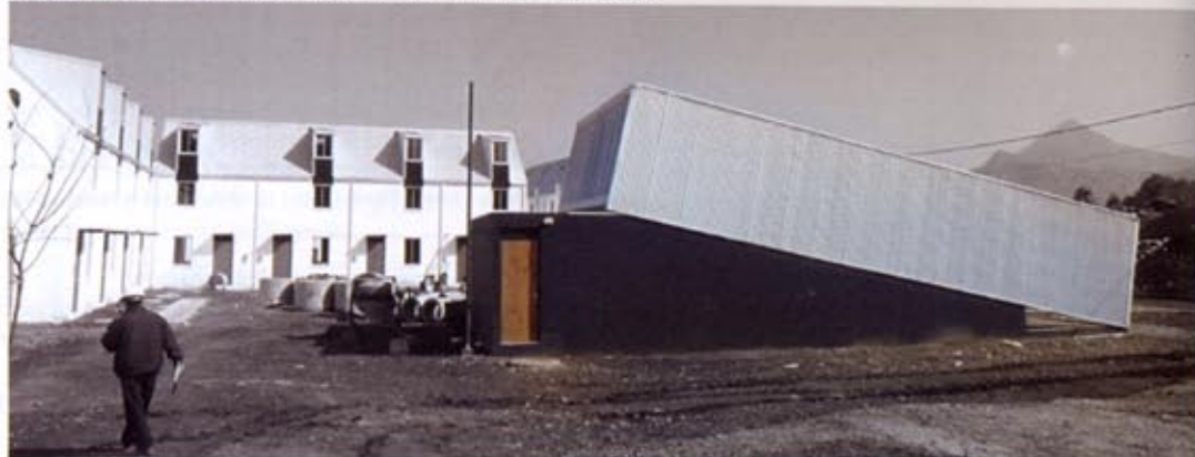
Elemental Community Center, Santiago, Cile / Chile, 2010