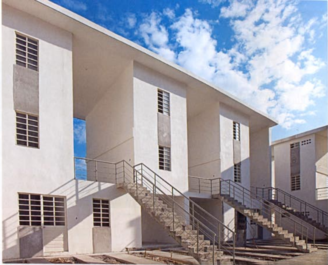
Elemental Housing (70 unità / units), Monterrey, Messico / Mexico, 2009

A tribute to one of the few contemporary architects who persists in trying to give his architecture a political meaning. Each time, in each new place, he's able to produce surprises without worrying obsessively about his personal style. (sb)