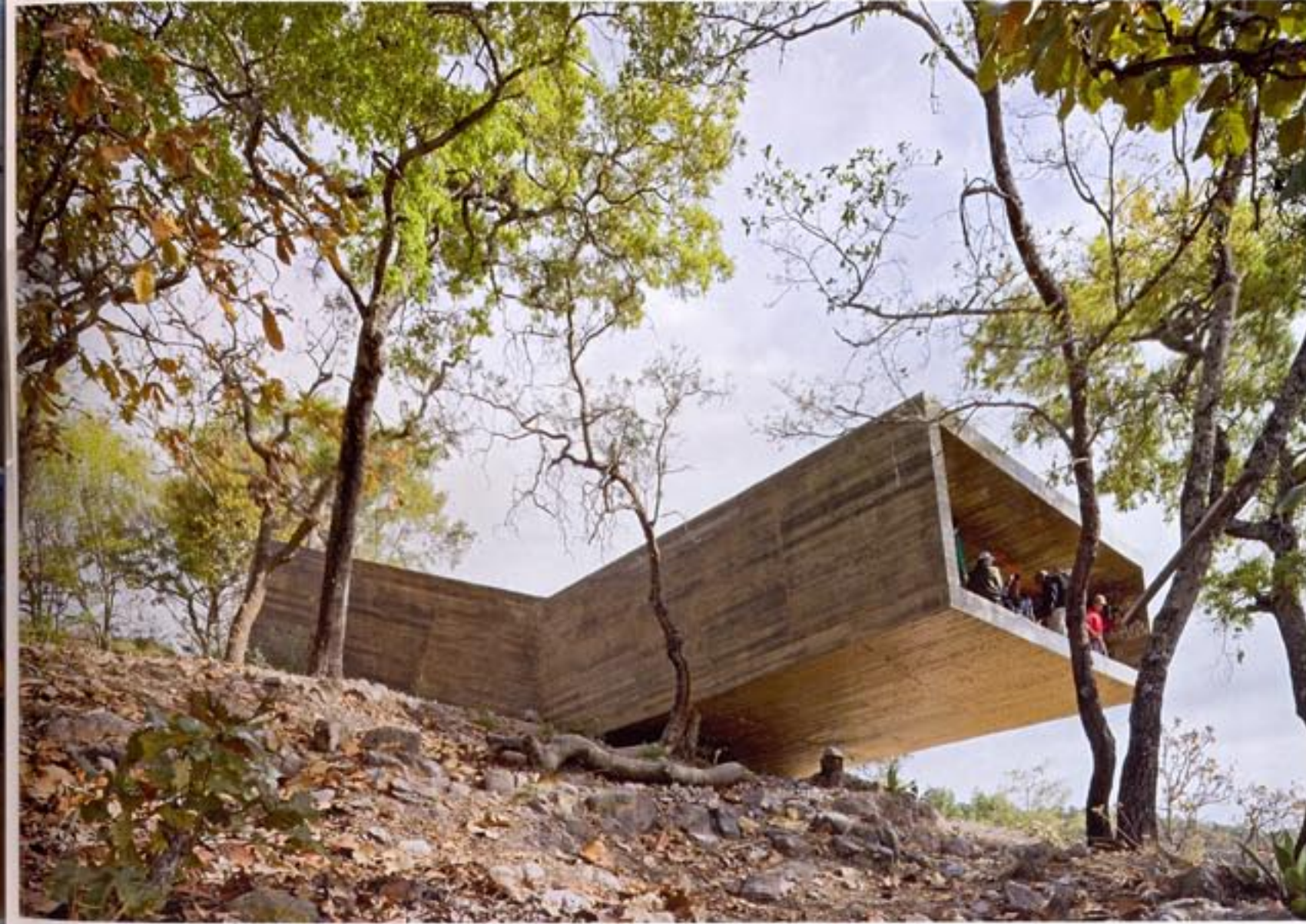
Mirador Espinazo del Diablo, Jalisco, México, 2009-2010. Belvedere / Lookout Point Elemental – Alejandro Aravena www.elementalchile.cl