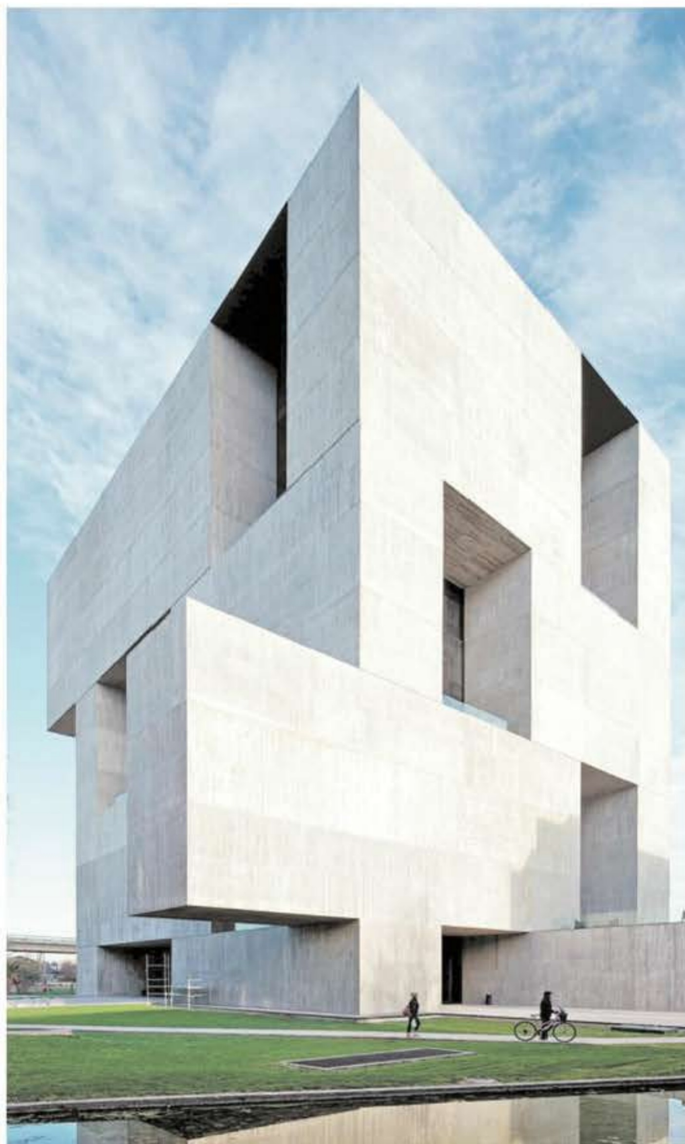
►► El Centro de Innovación UC costó US$ 18 millones.

El edificio diseñado por Elemental, un gran cubo de hormigón con volúmenes que escapan del eje y grandes huecos que esconden ventanas, destacó tanto por su diseño estético como por sus