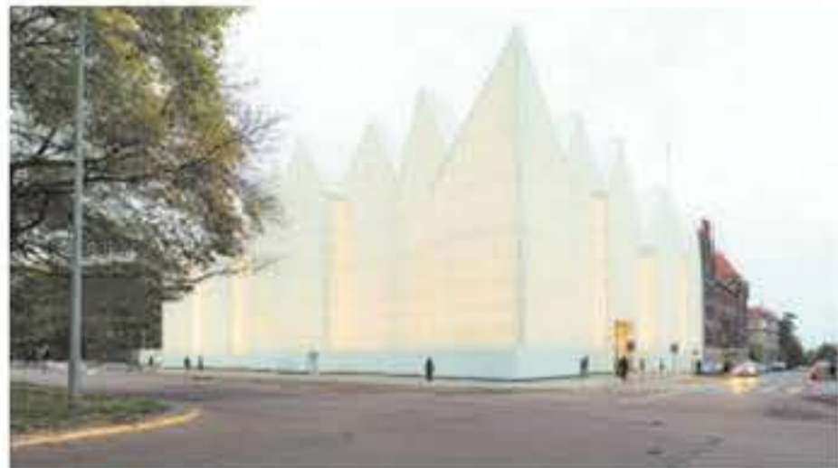
►► Filarmónica de Szczecin, en Polonia.