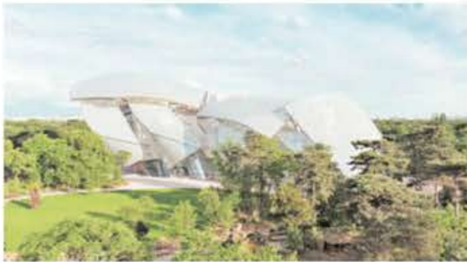
►► Fundación Louis Vuitton, París, Frank Gehry.