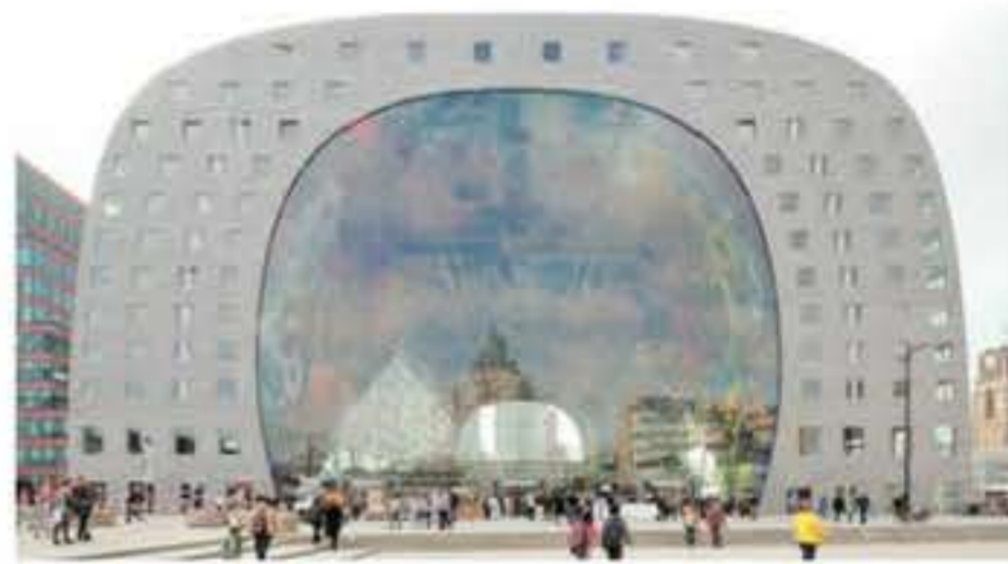
►► Markthal, Rotterdam, de la oficina MVRVD.